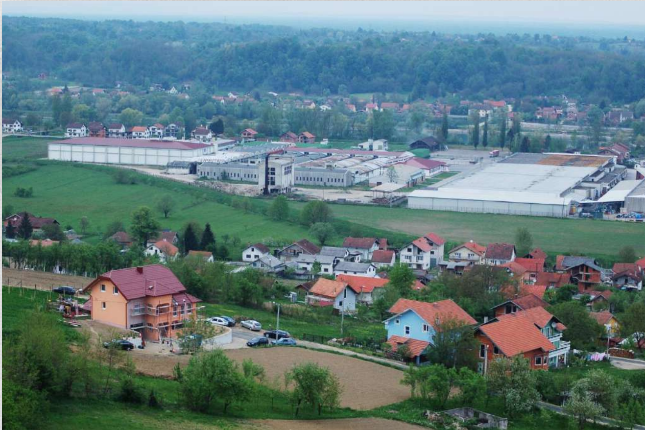
Pogled na “Unaplod” i “Dubicotton”