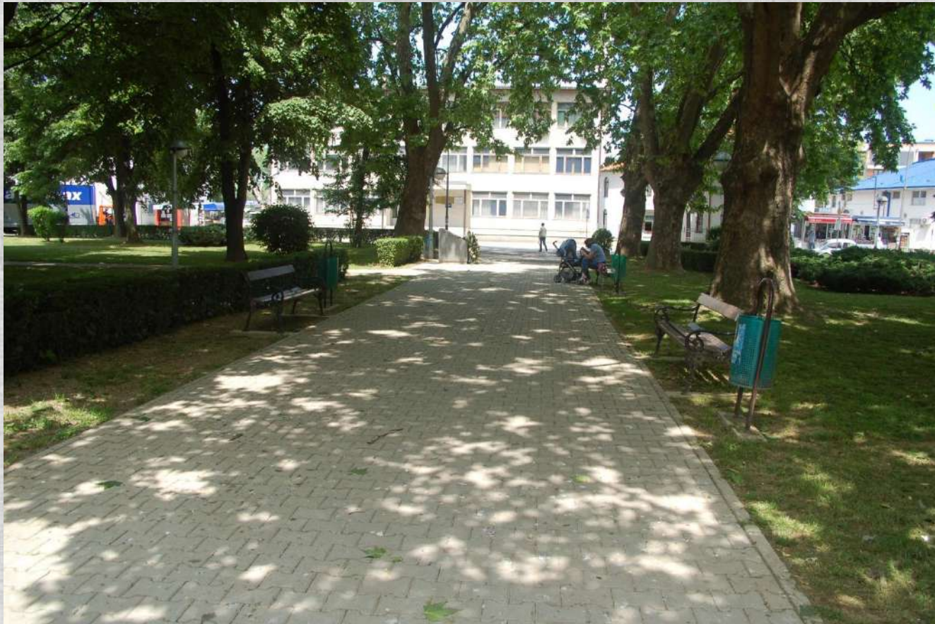
Detalj iz Gradskog parka