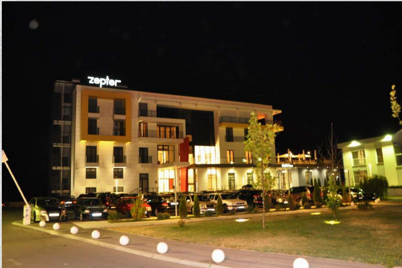
Zepter Hotel - natt utsikt

PLACE - PRICE - POTENCIAL - PROVED - PLEASANT