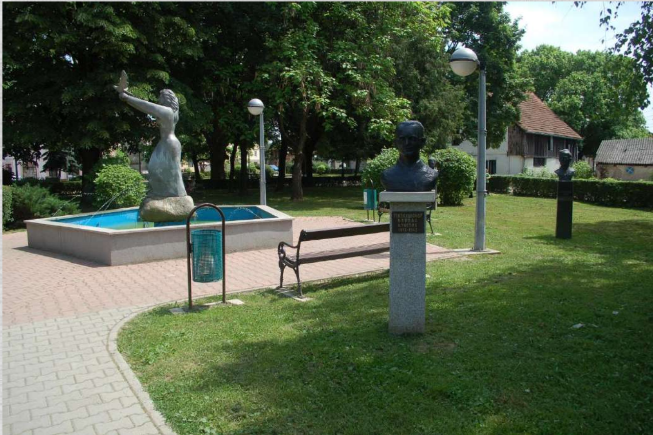
Detalj från stadsparken