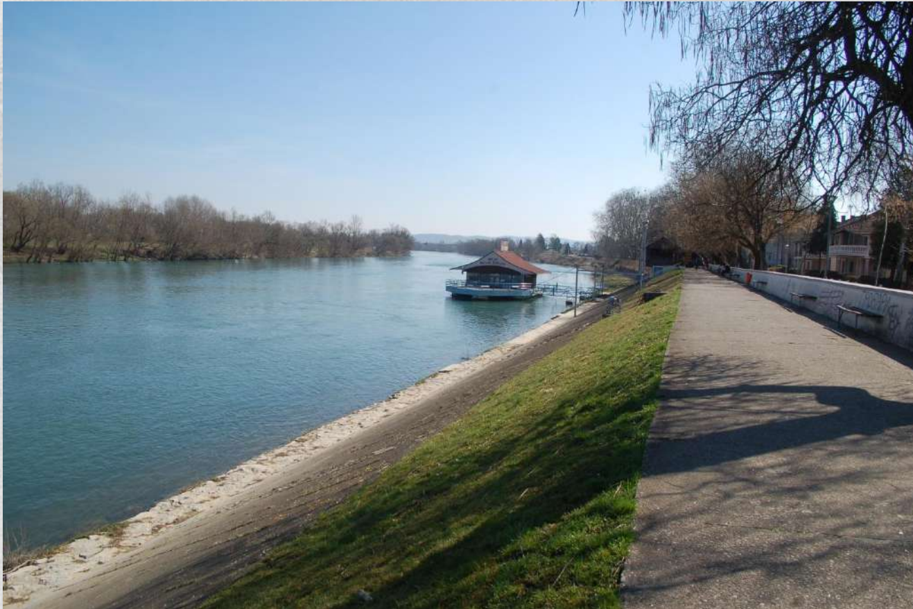
Floden Una, promenad stig, brygga