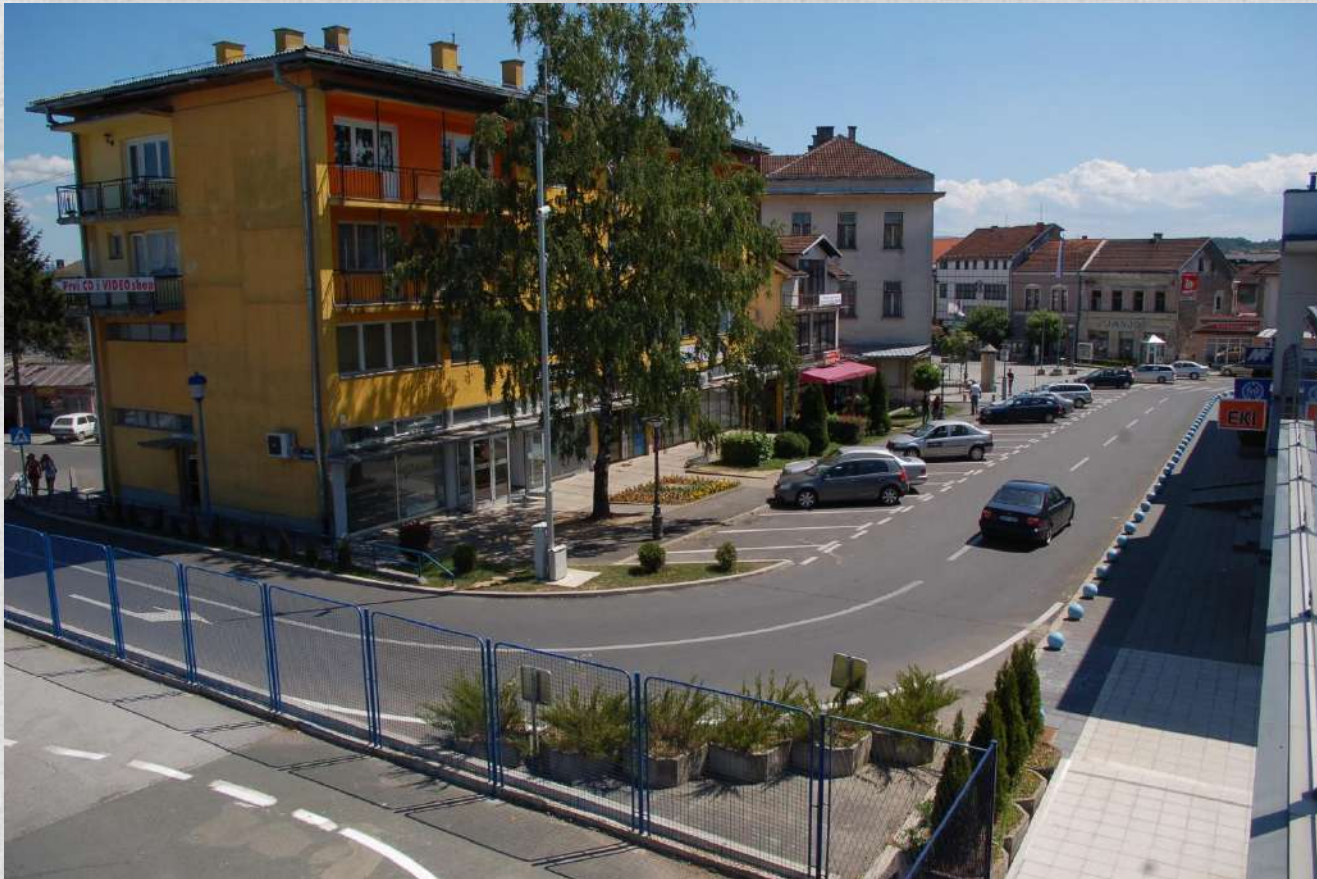
Detalj från centrum