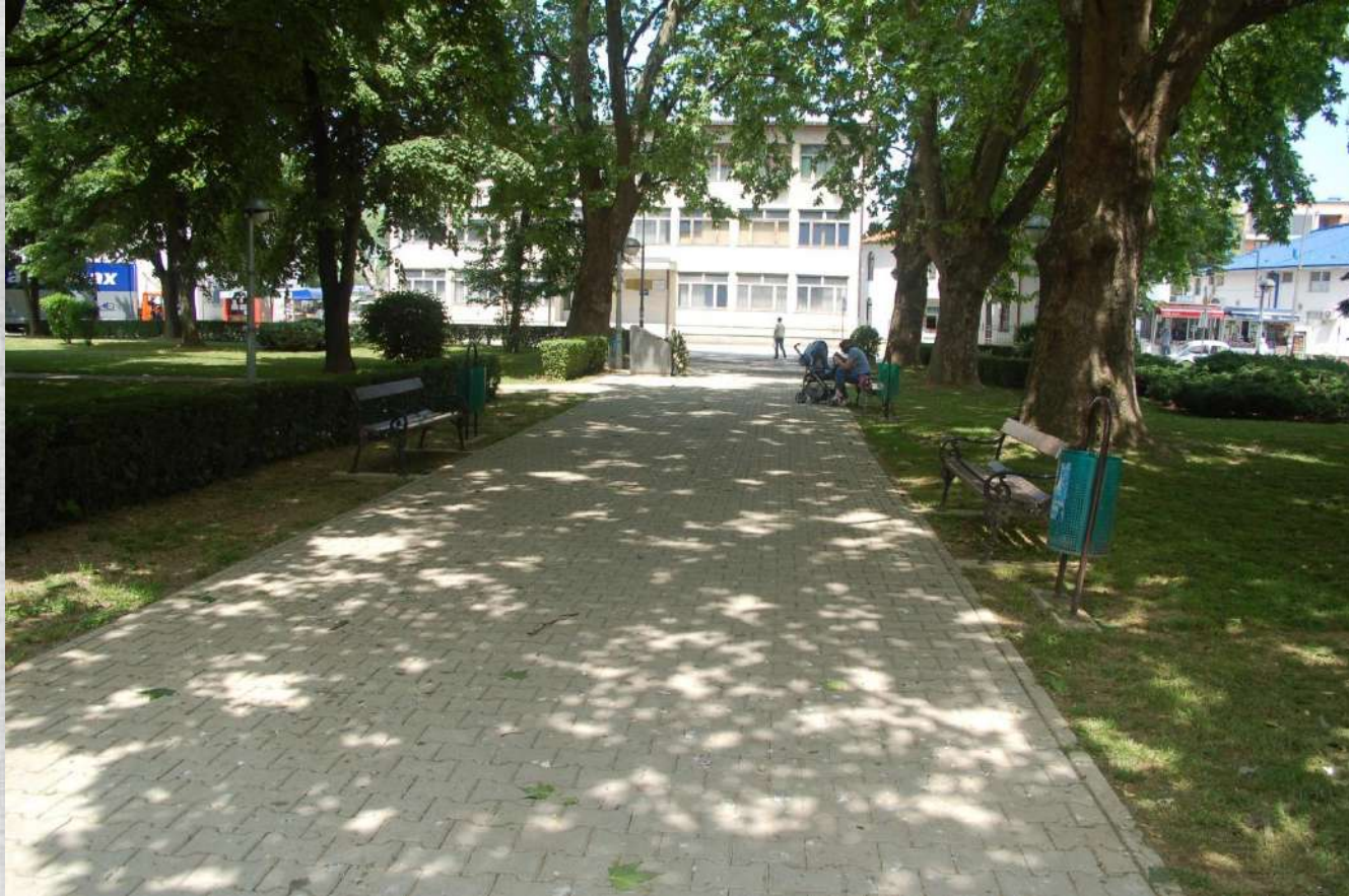
Detalj från stadsparken